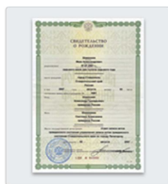
Свидетельство о рождении ребенка