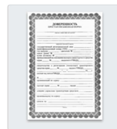
Если вы не родитель — доверенность или другой документ, подтверждающий право предоставлять интересы ребенка